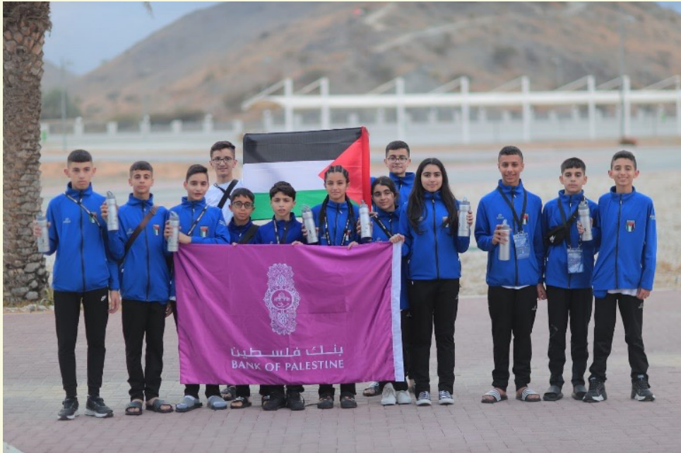
دعم اتحادات رياضية مختلفة