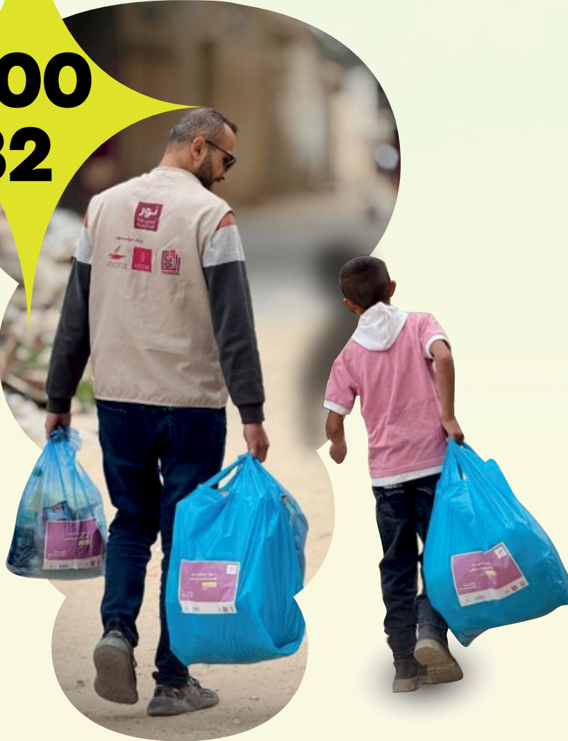
تدخلات برنامج نور لرعاية الايتام