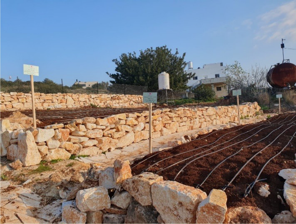
انشاء حديقة بيئية في محمية ام التوت