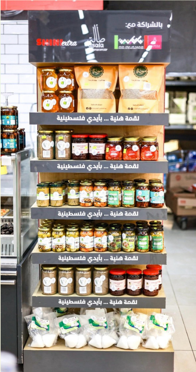
مبادرة اسواق فلسطينية