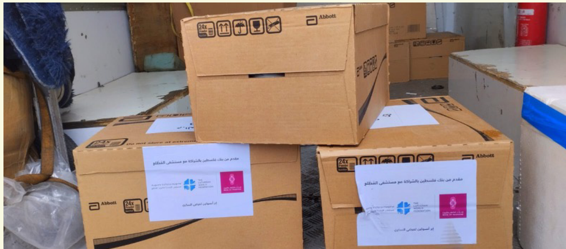
تسليم ادوية للنازحة في مدينة جنين